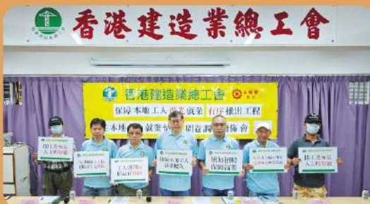
建造總會：關注本地工人就業情況