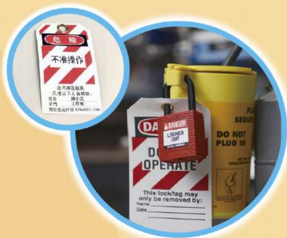
電源插頭鎖具套裝