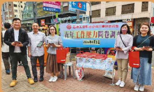
青委：青年工作壓力問卷調查街站