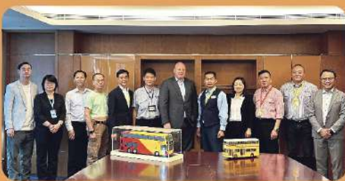
汽車總會：城巴分會與城巴管理層會面 討論員工合理待遇事宜