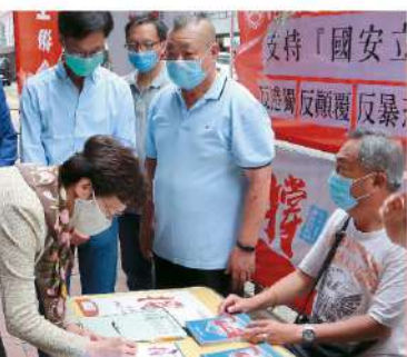
年 參與「撐國安立法聯合陣線」