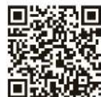
「五·一宣言」 政策建議

參與今次的勞工界聯合公布「五·一宣言」包括香港工會聯合會、港九勞工社團聯合會、港九工團聯合總會、香港高級公務員協會、香港政府華員會、政府人員協會、香港公務員總工會、香港公務員工會聯合會及香港特區政府公務人員聯合會。