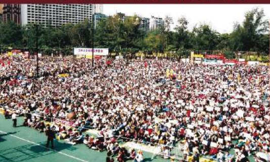
| 2002年 參與「支持基本法23條立法」大集會