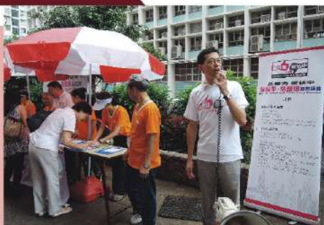
| 2014年 參與「保普選反暴力」大聯盟