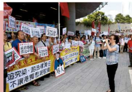
| 2016年 參與「反港獨 撐釋法」大聯盟