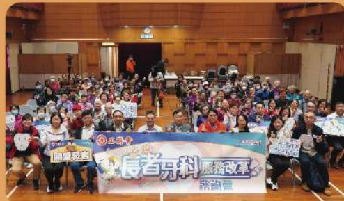
工聯會舉行長者牙科服務改革諮詢會 商討未來牙科改革方向