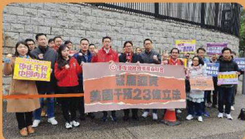
工聯會嚴厲譴責美國政府干預23條立法