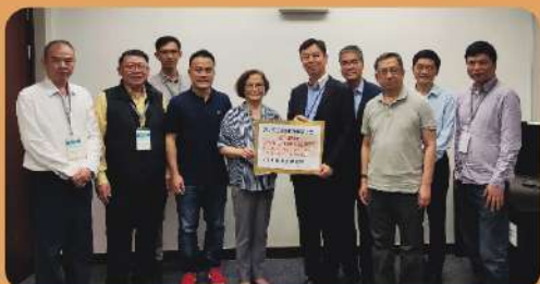
職安協：對勞工處《預防工作中暑指引》提出優化建議