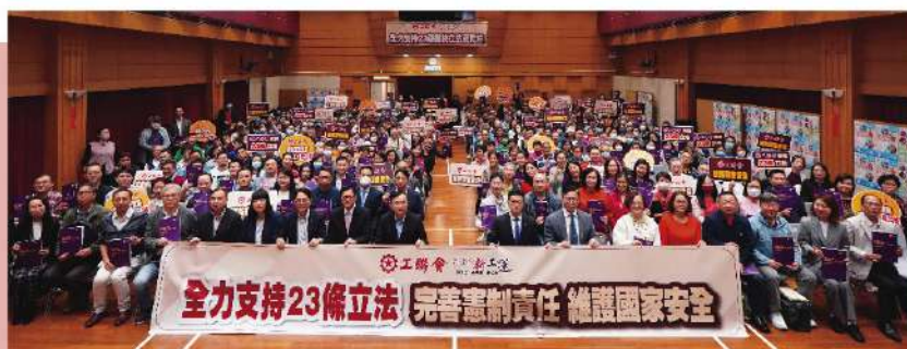
| 2024年 全力支持23條立法