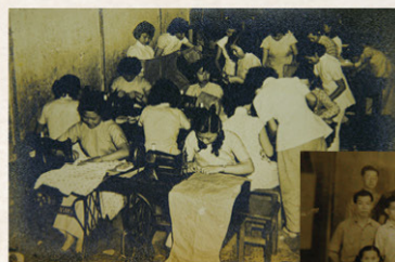
▲ 工會舉辦的車縫班。