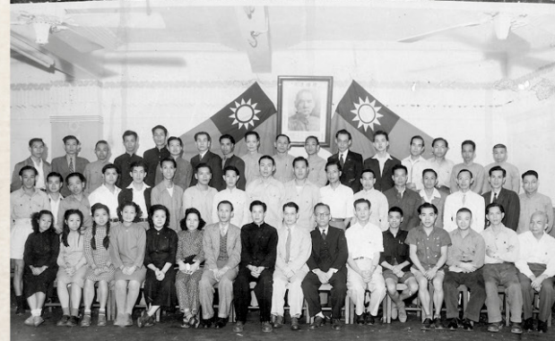
▲ 工聯會第一屆理事就職。