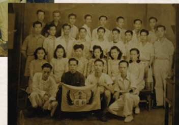
▲ 政軍醫前身為政府華人職工聯愛會，在 1948 年改名為政府、軍部、醫院華員職工會，即簡稱政軍醫工會，圖為工會組成聯愛劇團。